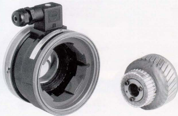
RDC 215 KE